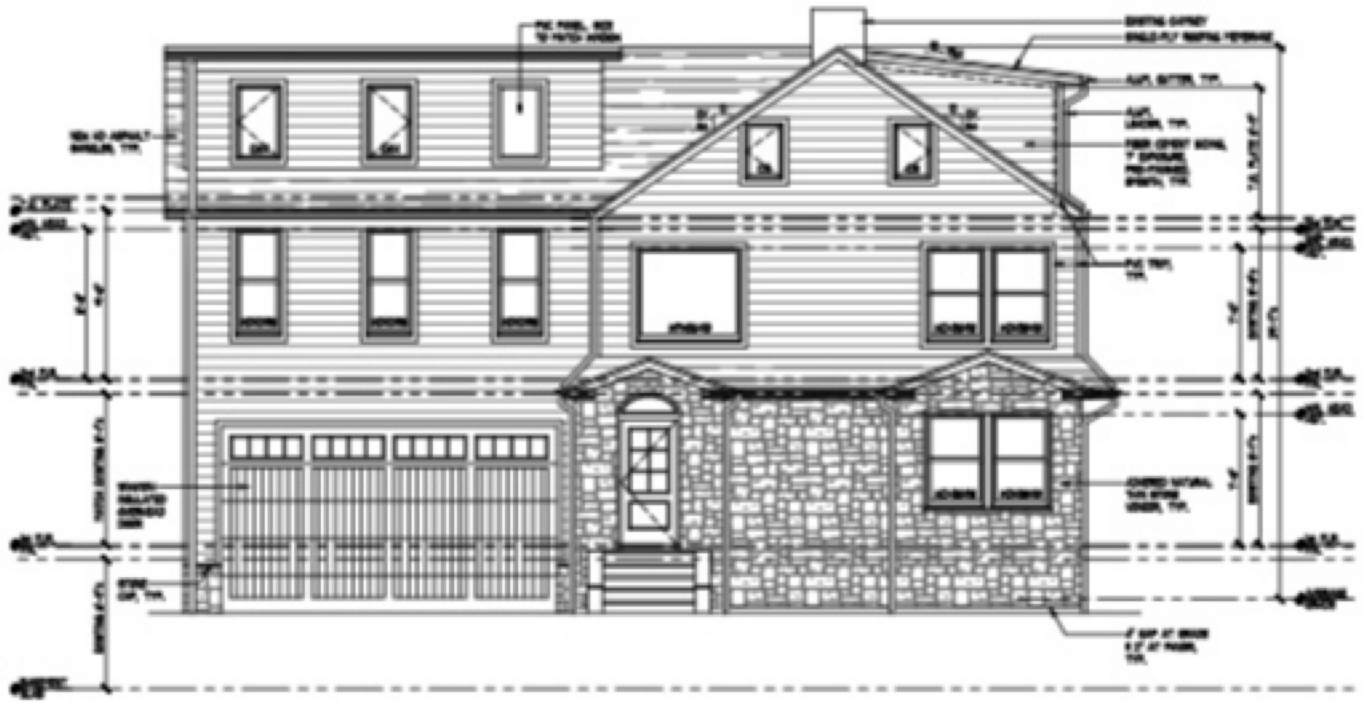
(A) PROPOSED FRONT ELEVATION 1/4" = 1'-0"